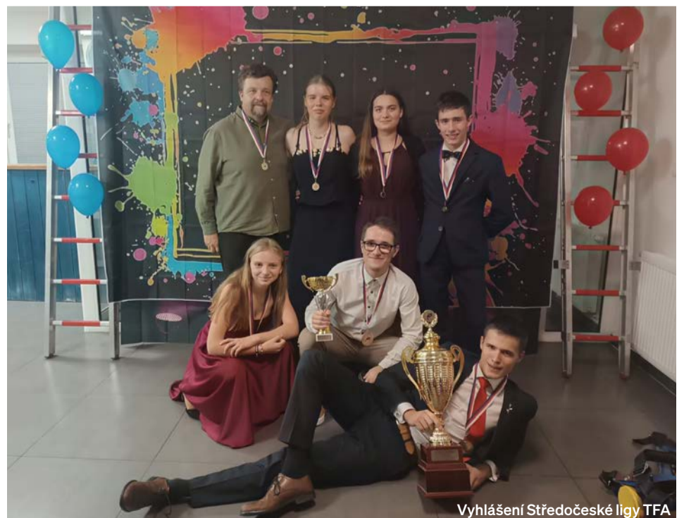
Vyhlášení Středočeské ligy TFA