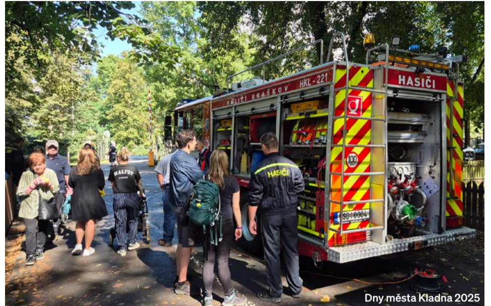
Dny města Kladna 2025

Naši členové také kromě času věnovaného „hasičině“ dávají svůj další volný čas často ve prospěch obce. V souvislosti s projektem „Revitalizace BRAŠKOVSKÉHO POTOKA – VY-