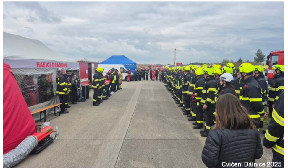
Cvičení Dálnice 2025