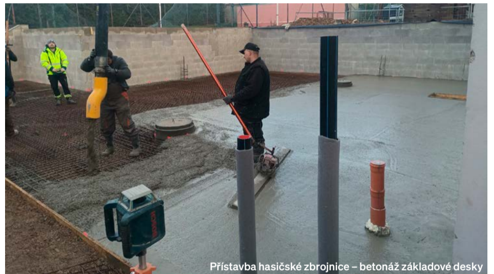
Přístavba hasičské zbrojnice – betonáž základové desky