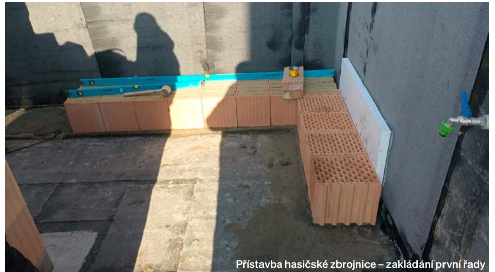
Přístavba hasičské zbrojnice – zakládání první řady