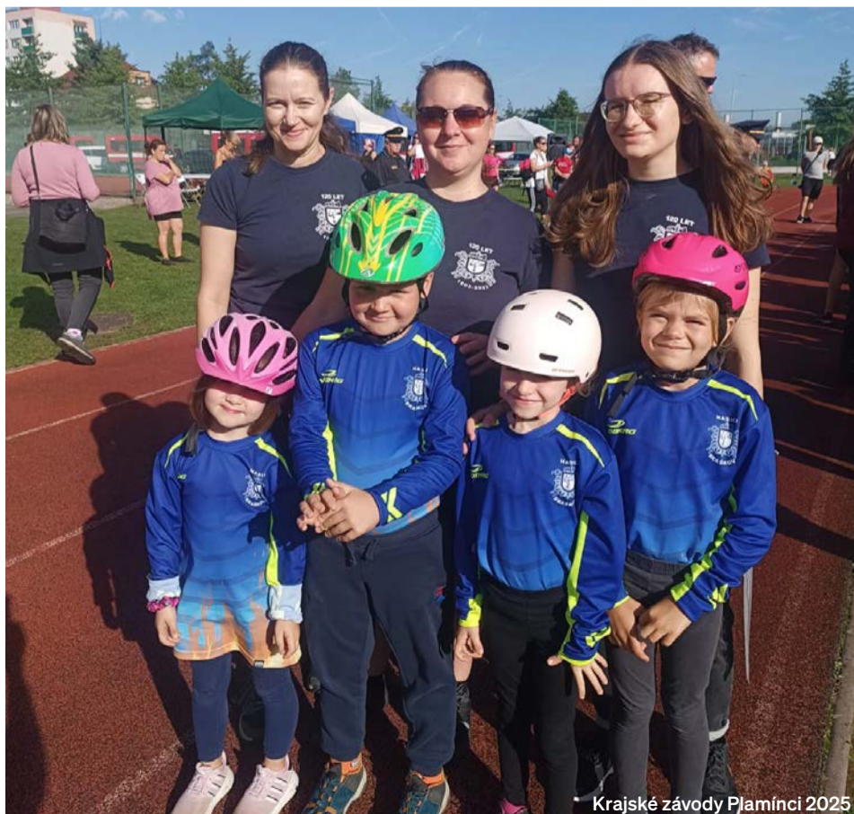
Krajské závody Plamínci 2025