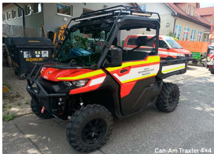
Can-Am Traxter 4x4