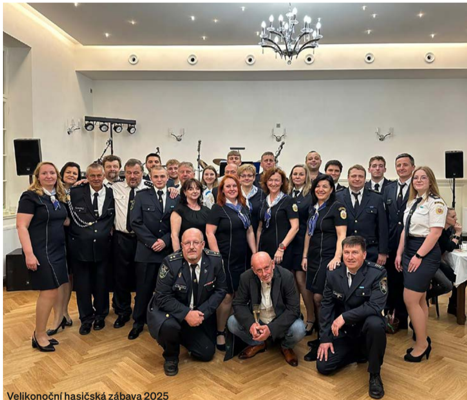
Velikonoční hasičská zábava 2025

Díky získaným dotacím od MV ČR a Středočeského kraje jsme letos v červenci zahájili přípravné práce pro přístavbu hasičské zbrojnice. Ty stejně, jako před skoro dvaceti lety, kdy začala rekonstrukce tehdejší hasičské zbrojnice, byly stavební firmou zahájeny začátkem srpna. Tato přístavba nahradí stávající provizorní přístřešek a malou garáž. Nové prostory poskytnou zázemí pro techniku pořízenou v posledních letech. Pod novou garáží bude vybudována nádrž o objemu 28 m 3 pro zásobu užitkové vody. Tuto vodu budeme používat pro plnění cisteren a mytí veškeré zásahové techniky. Součástí přístavby budou i prostory pro záložní dieselagregát a baterie k FVE. Dieselagregát bude sloužit i pro napájení budovy