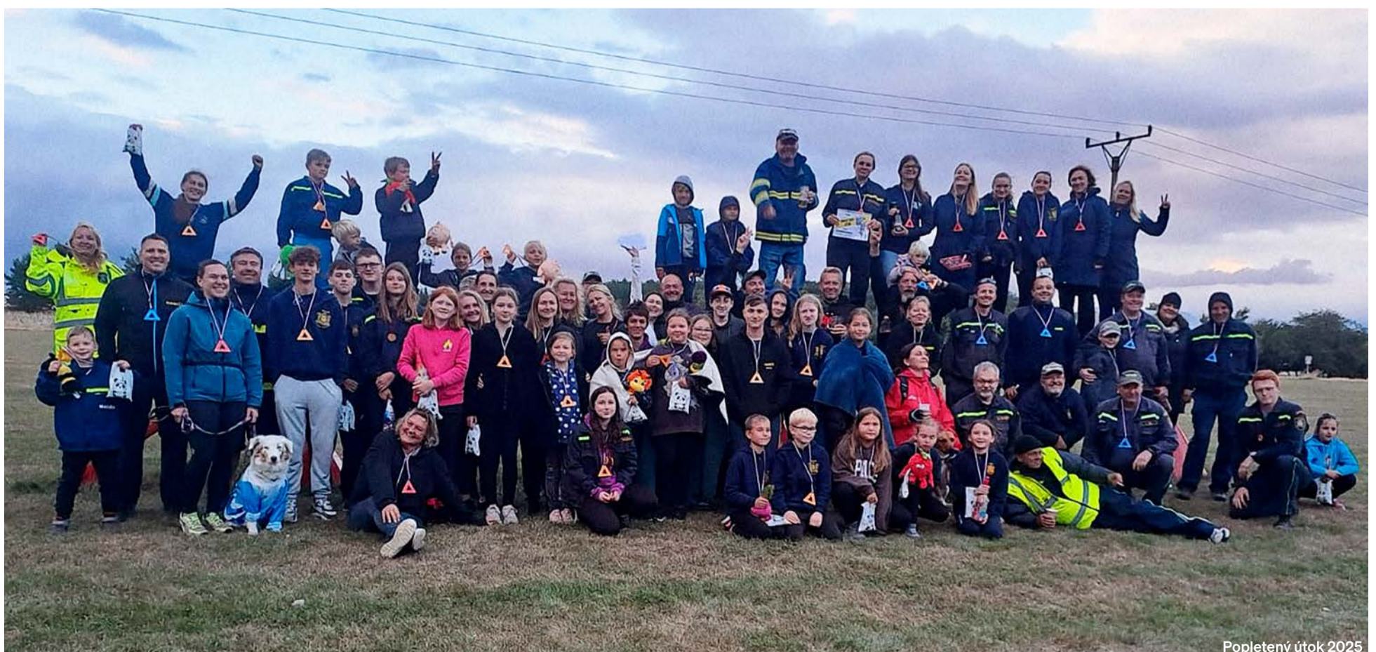
Popletený útok 2025