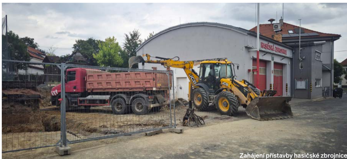
Zahájení přístavby hasičské zbrojnice