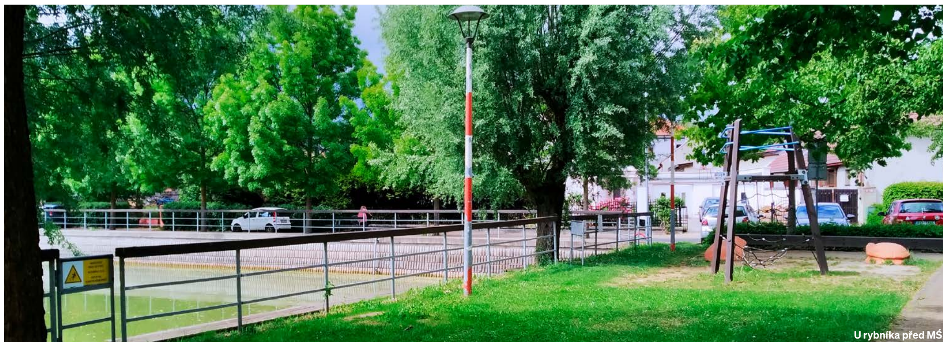
U rybníka před MŠ