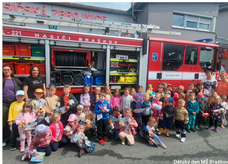
Dětský den MŠ Braškov