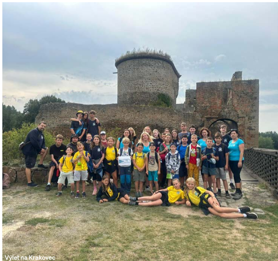
Výlet na Krakovec