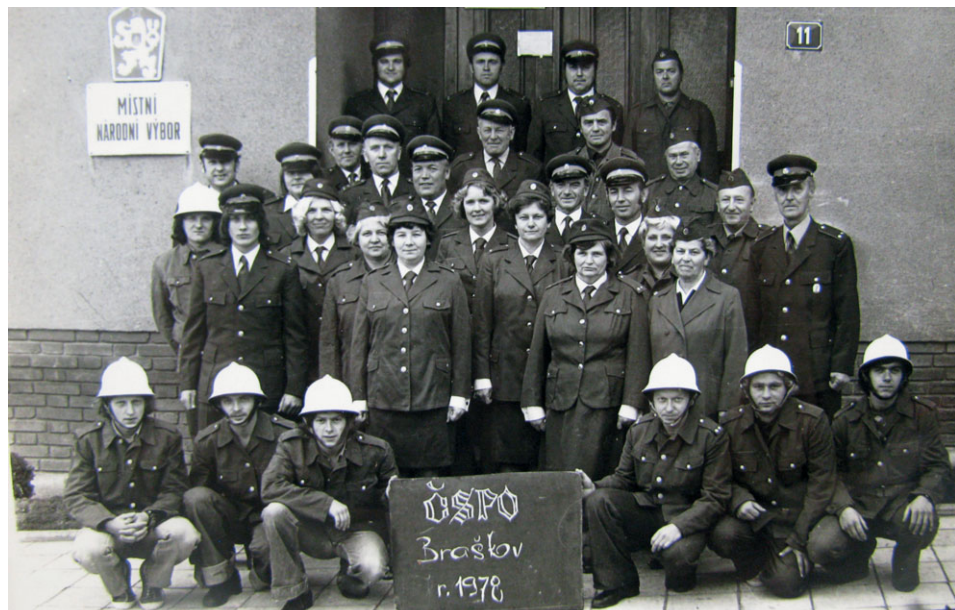
Požárníci Braškov, 1978