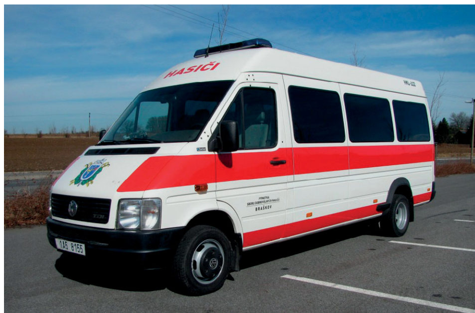
VW LT46, rok výroby 2008