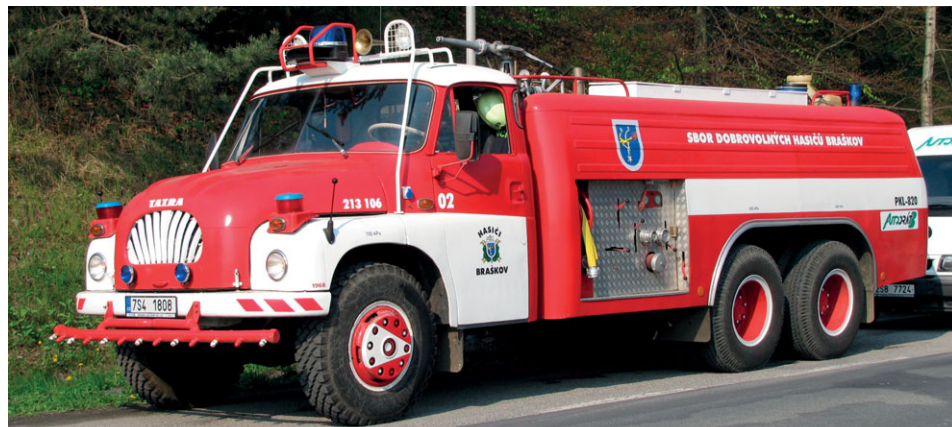
CAS 32 Tatra 138, rok výroby 1968