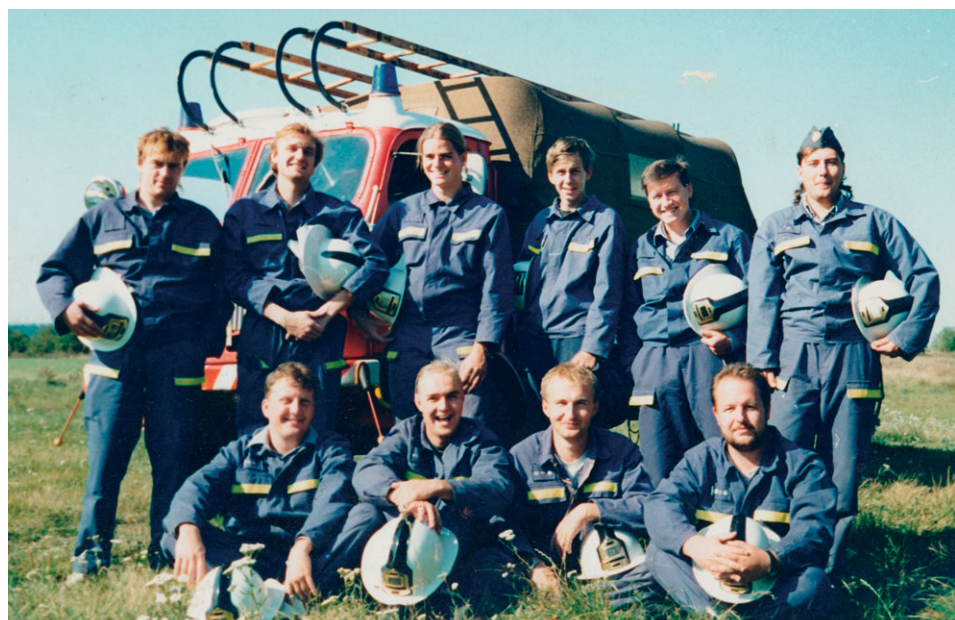
Založení JSDH, 1997