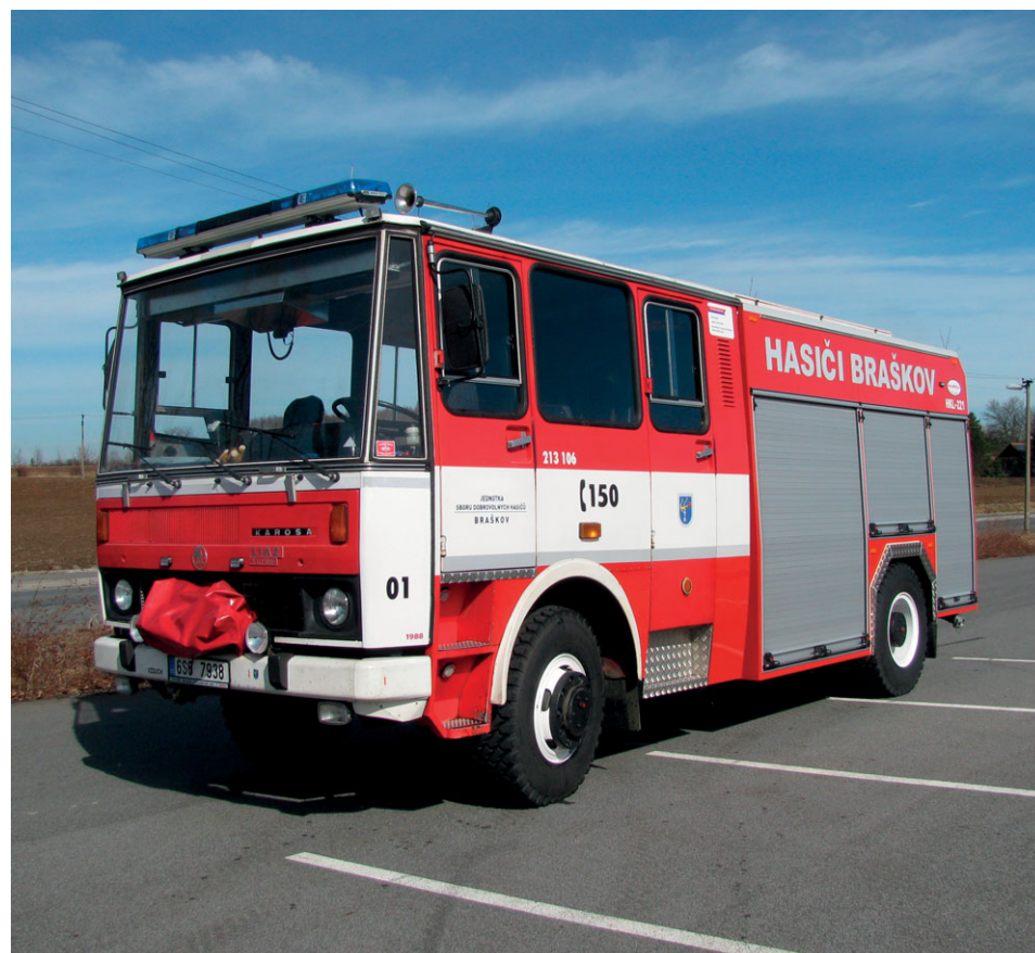
CAS25 LIAZ, rok výroby 1988