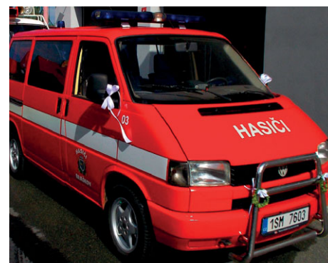
DA VW T4, rok výroby 1994