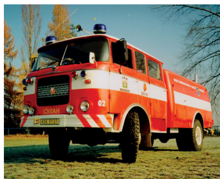
CAS 25 ŠKODA RTHP, rok výroby 1967