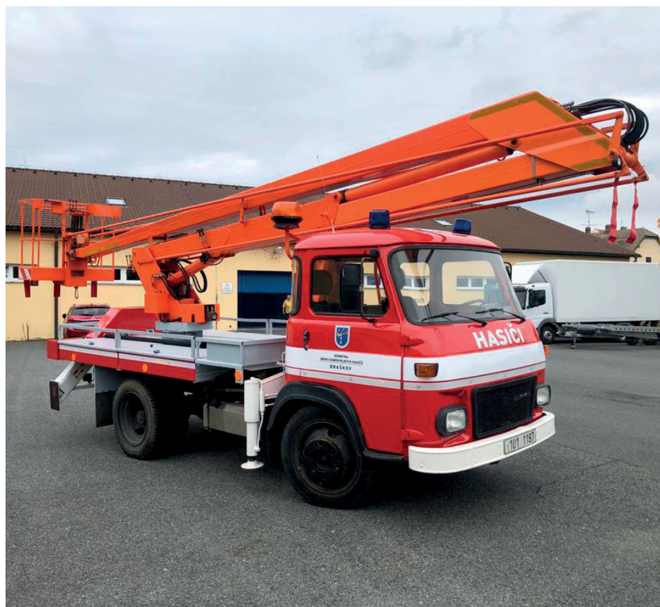
AP 16 AVIA, rok výroby 1988

Děkujeme za podporu všem, kteří se dosud vystřídali v zastupitelstvu obce Braškov, v čele s jejím starostou. Bez této podpory bychom nikdy nebyli na této úrovni. Děkujeme i vedení obcí Kyšice a Velká Dobrá, pro které jsme přes deset let místní jednotka a s kterými rádi spolupracujeme. Samozřejmě děkujeme i všem firmám, podnikům, organizacím i jednotlivcům, kteří nás za dobu našeho fungování podpořili a přispěli tak k našemu fungování, a doufáme, že veškerá nastavená spolupráce se bude nadále jen rozvíjet.