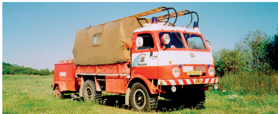
DA Tatra 805, rok výroby 1957