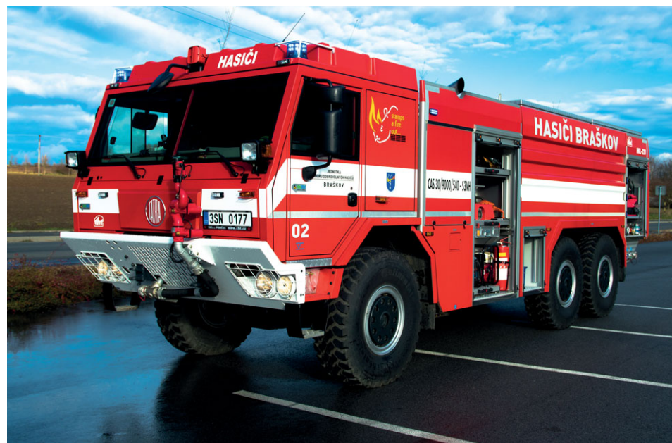
CAS 30 TATRA 815-7, rok výroby 2017