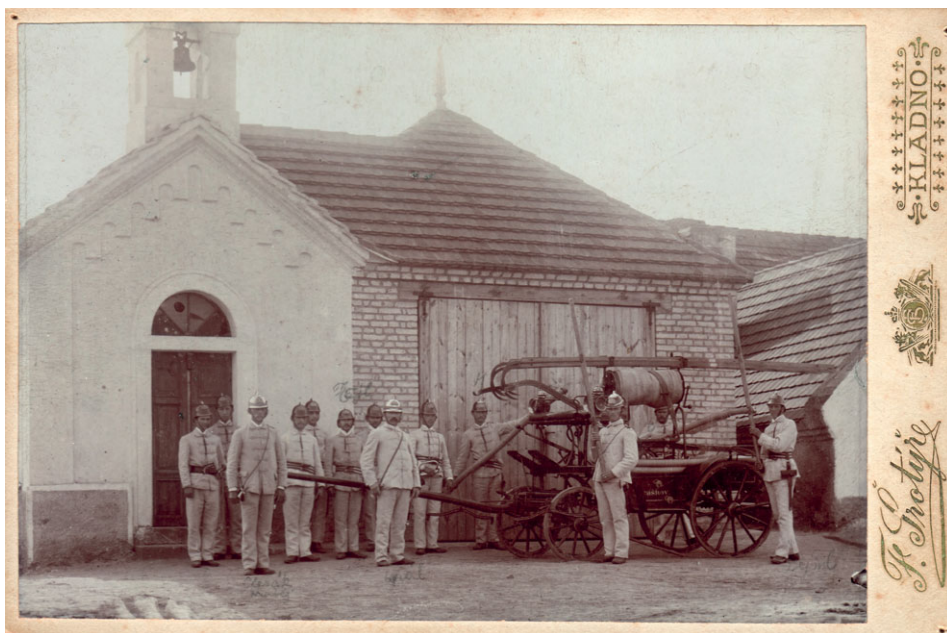
První hasiči, 1903