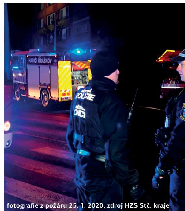
fotografie z požáru 25. 1. 2020