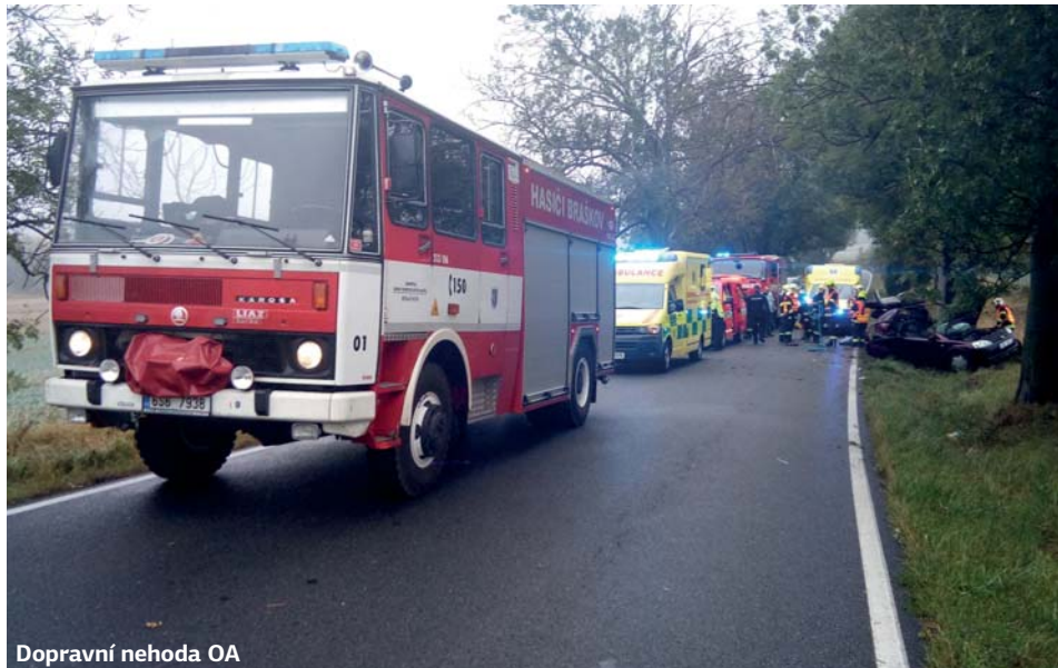
Dopravní nehoda OA