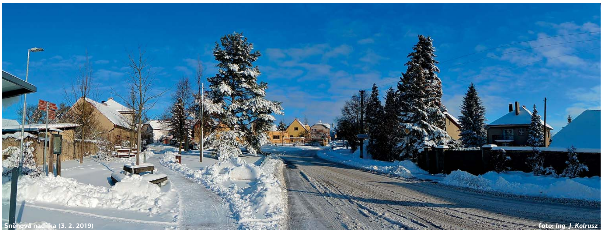
Sněhová nadílka (3. 2. 2019)