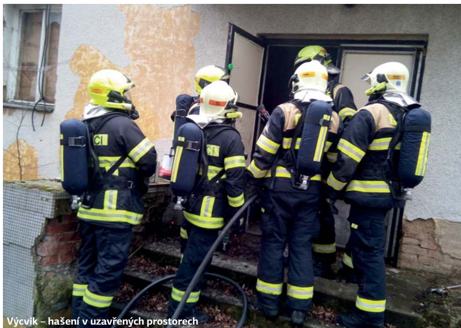
Výcvik – hašení v uzavřených prostorech