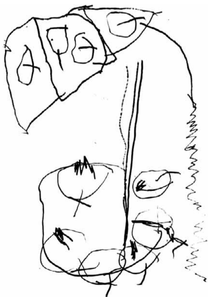
„Dům s kouřícím komínem a strom s jablky“ - Nelinka Vagerová (3 roky)