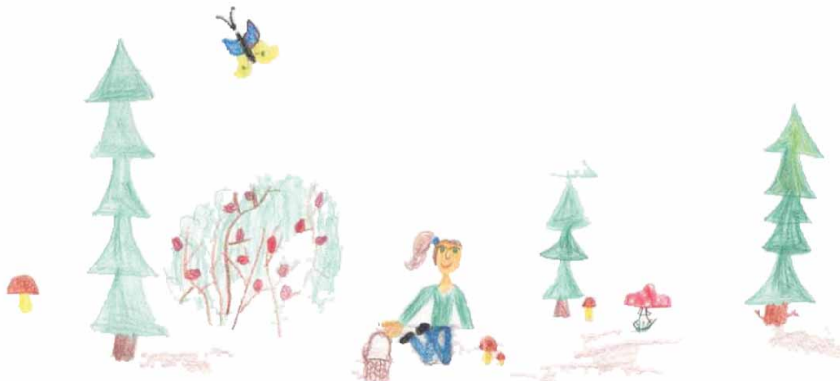
„O prázdninách v lese“ - Lucie Hospodářová (7 roků)