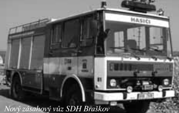
Nový zášahový vůz SDH Braškov