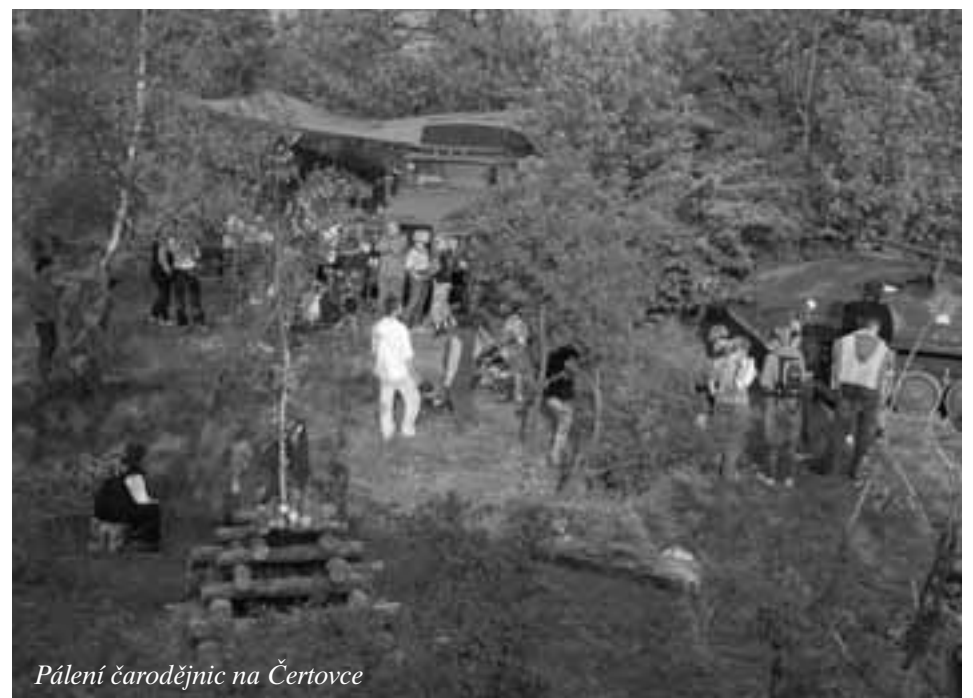
Pálení čarodějnic na Čertovce