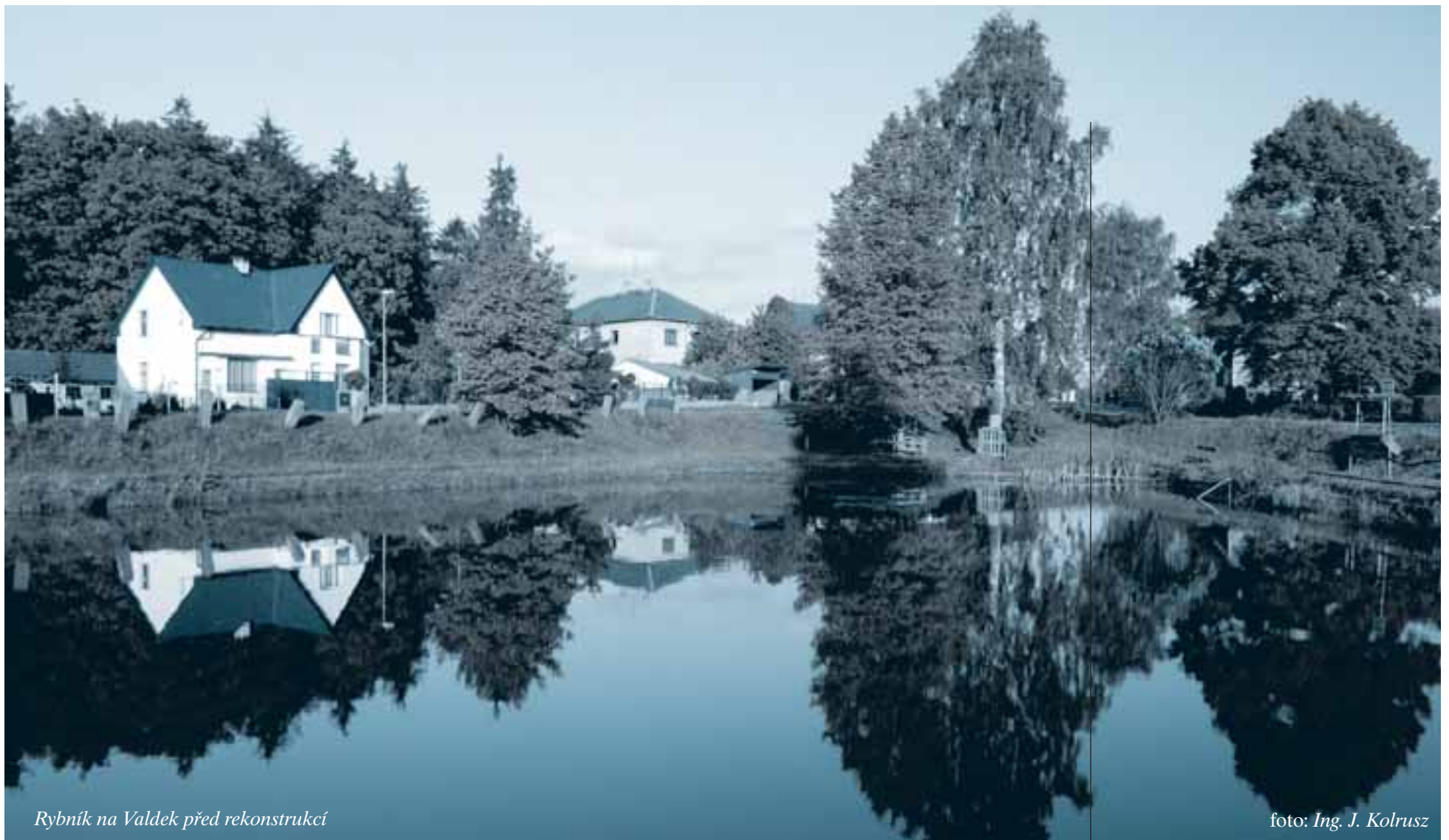
Rybník na Valdek před rekonstrukcí