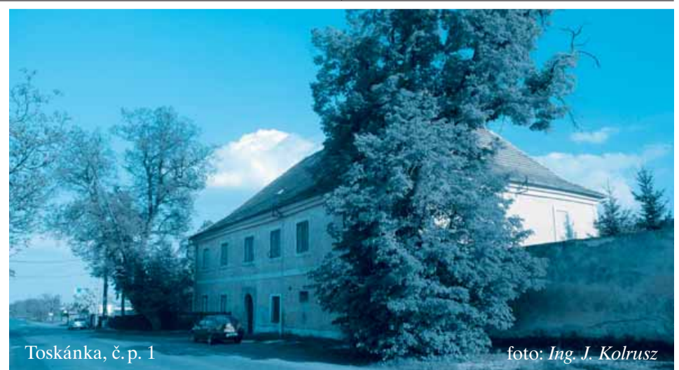
Toskánka, č. p. 1