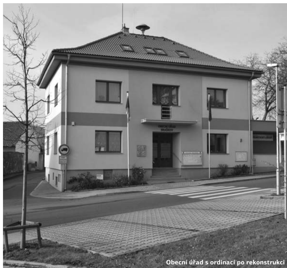
Obecní úřad s ordinací po rekonstrukci