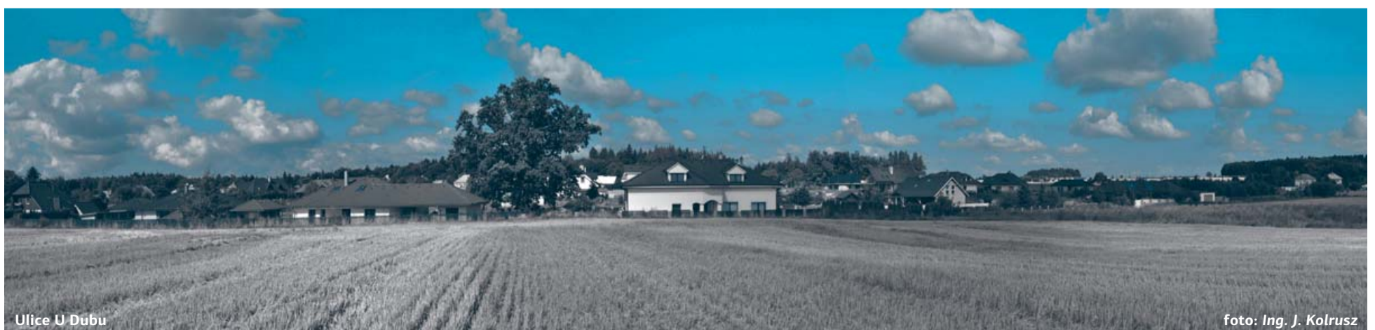
Ulice U Dubu

v souladu s požadavkem § 10g odst. 4 zákona č. 100/2001 Sb., že Krajský úřad Středočeského kraje, odbor životního prostředí a zemědělství vydal souhlasné stanovisko z hlediska posuzování vlivů Územního plánu Braškova na životní prostředí, a to s podmínkami. Část podmínek ze stanoviska, týkajících se podrobnosti územního plánu byly respektovány, a to podmínky pouze v podrobnosti, kterou umožňuje územní plán. Některé podmínky nebyly akceptovány. Podrobně zpracováno v odůvodnění územního plánu zpracovaném pořizovatelem.