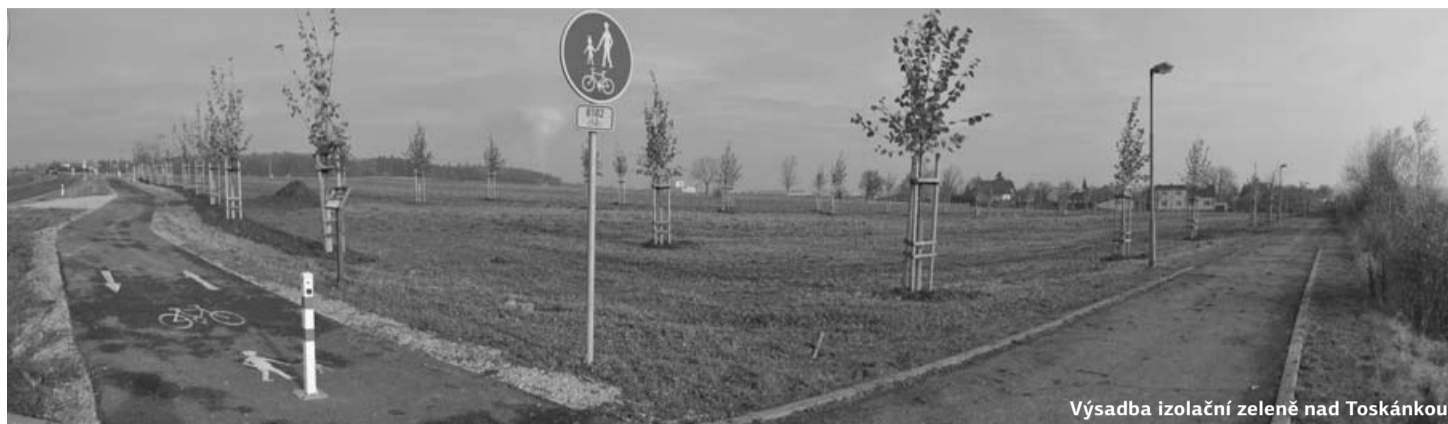
Výsadba izolační zeleně nad Toskánkou

1) Vztahuje se k suchým spalínům, teplotě 273,15 K, tlaku 101,325 kPa a k referenčnímu obsahu kyslíku 10 %; pro sálavé spalovací stacionární zdroje, určené pro připojení na teplovodní soustavu ústředního vytápění a k instalaci v obytné místnosti, se hodnoty vztahují k referenčnímu obsahu kyslíku 13 %. 2) TOC = celkový organický uhlík, kterým se rozumí úhnná koncentrace všech organických látek s výjimkou methanu vyjádřená jako celkový uhlík. 3) Nevztahuje se na sálavé spalovací stacionární zdroje, určené pro připojení na teplovodní soustavu ústředního vytápění a k instalaci v obytné místnosti.