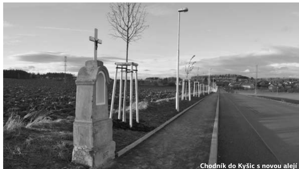
Chodník do Kyšic s novou alejí