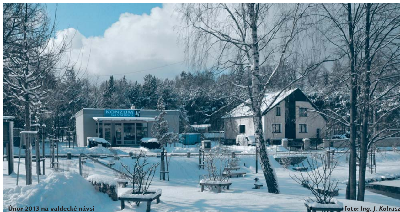
Únor 2013 na valdecké návsi