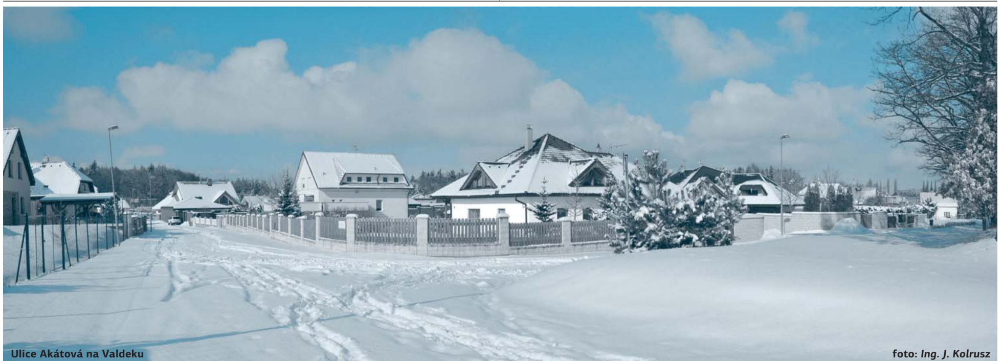
Ulice Akátová na Valdeku