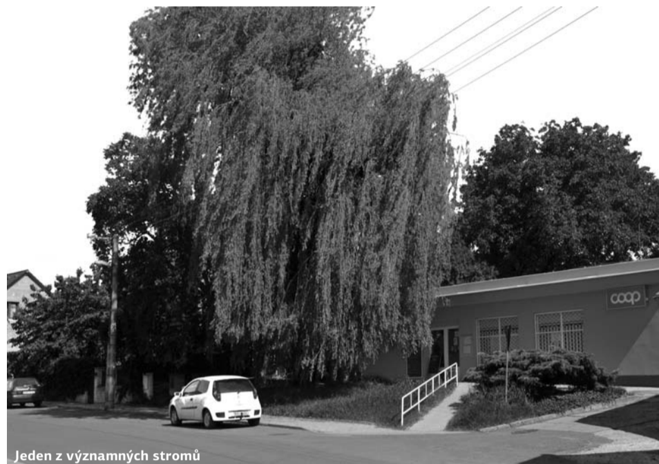
Jeden z významných stromů