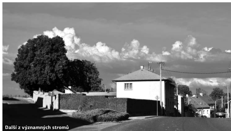
Další z významných stromů