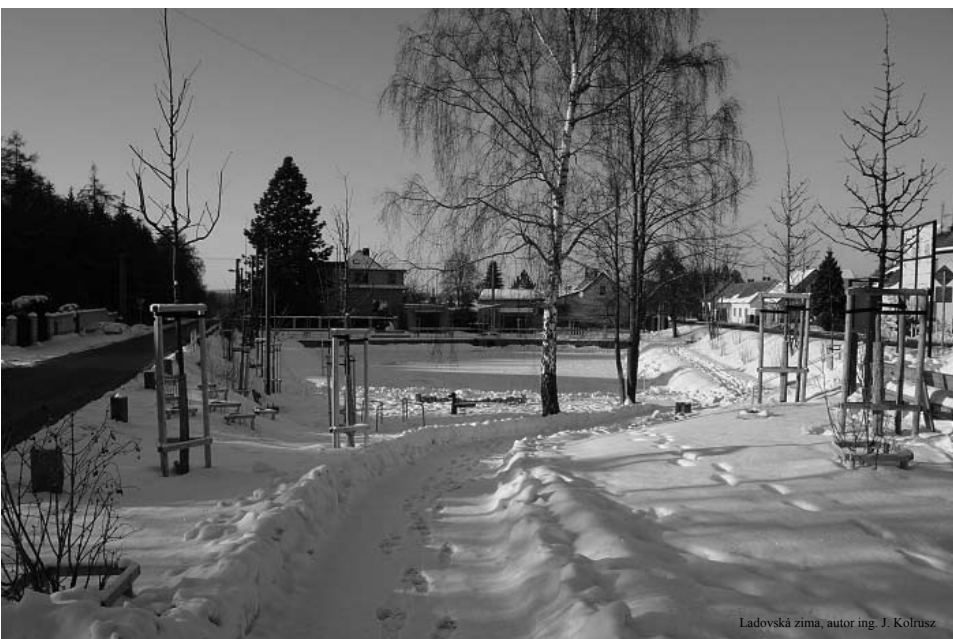
Ladovská zima, autor ing. J. Kolrusz